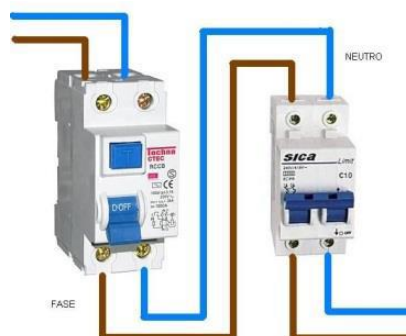
Conexión de Diferencial con Térmica.