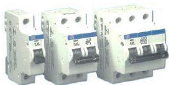
Tipos de llaves Térmicas.

Es un elemento de protección contra cortacircuitos y sobrecargas. Se instalarán con la sensibilidad adecuada para la protección de los conductores y equipos instalados en la derivación (como lo indica la Unifilar general adjunta).